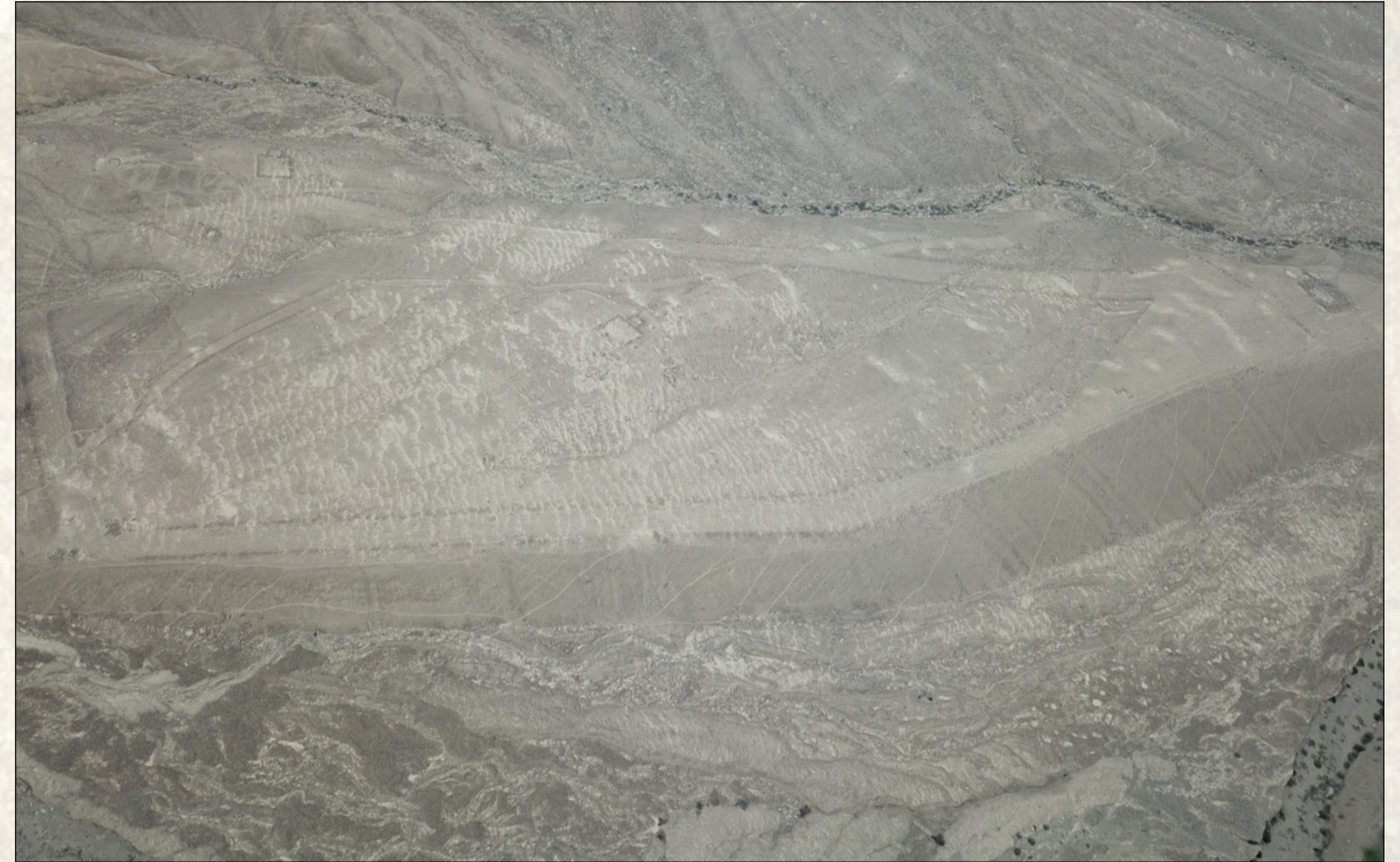
Figura 2. Explanada principal

A partir de la ubicación y diseño que presentan los geoglifos registrados en cerro Zapán, la función probable de estas explanadas estarían relacionadas a ceremonias realizadas durante el Intermedio Tardío / Horizonte Tardío, con el fin de aplacar las lluvias inusuales durante periodos de El Niño.