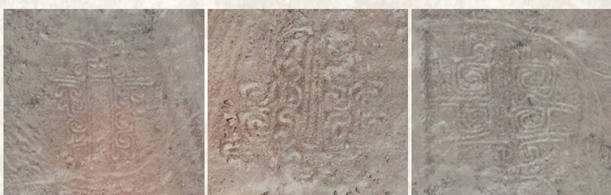
Figura 5, 6 y 7. Geoglifos figurativos zoomorfos