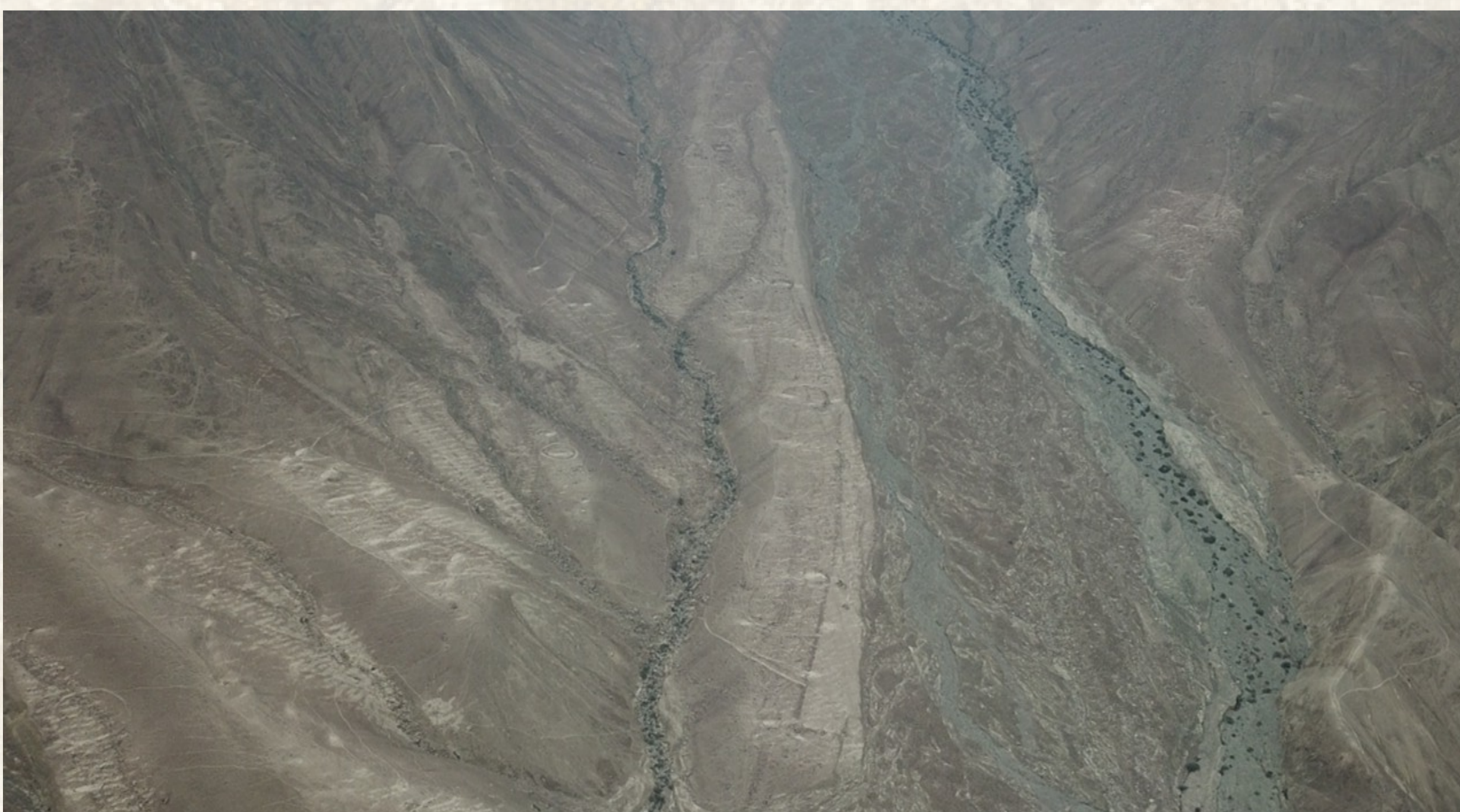
Figura 4. Explanada secundaria

Se registraron cinco (5) geoglifos asociados a estructuras de piedra. El geoglifo principal es de tipo circuito, del cual los cuatro geoglifos restantes están asociados a ésta. En estos últimos, se destaca un geoglifo figurativo de tipo antropomorfo.