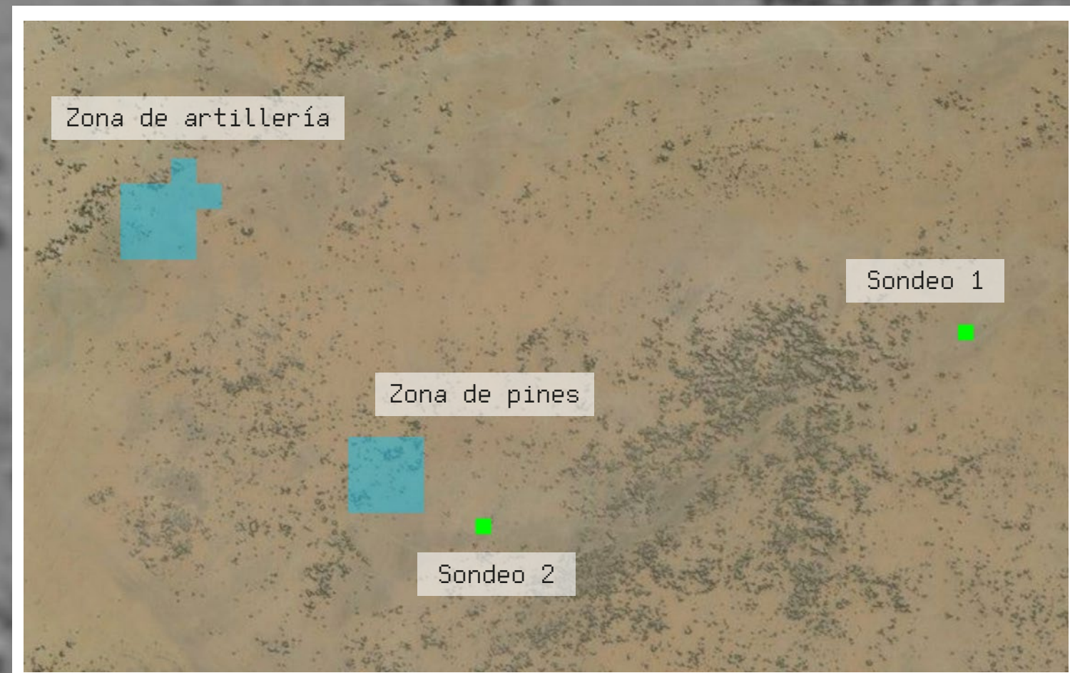
Ubicación de los sondeos en el área de investigación